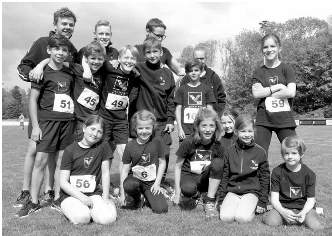
Das starke Vom Stein Team sorgte am Jugitag für hervorragende Leistungen und gute Stimmung

Wie üblich sehr früh am Sonntagmorgen reiste das vom Stein Team nach Widen, wo auf der Sportanlage Burkertsmatt der diesjährige Jugitag stattfand. Kaum angekommen mussten das Renndress und die Startnummern montiert werden und schon galt es, mit guten Leistungen in den Einzeldisziplinen des Mehrkampfes möglichst