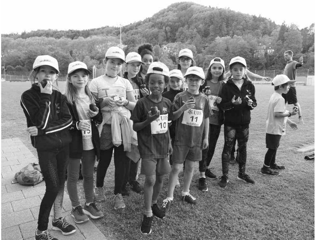
Zum Abschluss gab es für jeden eine Kappe und einen Mohrenkopf