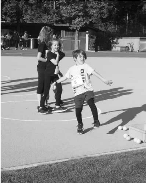
Laurin bei Anlauf...