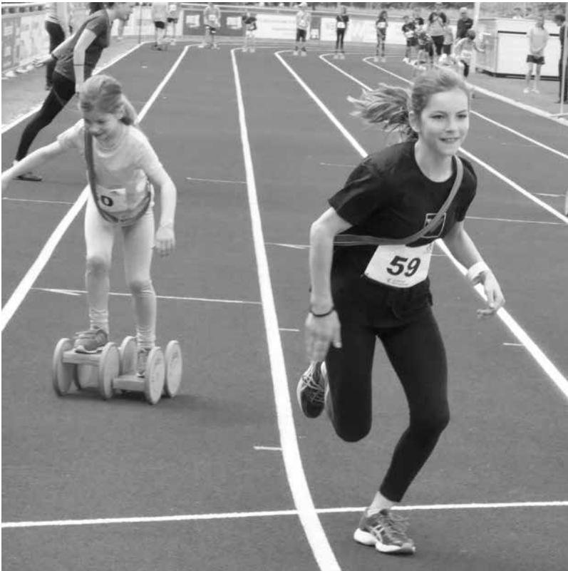
... und los Elise!