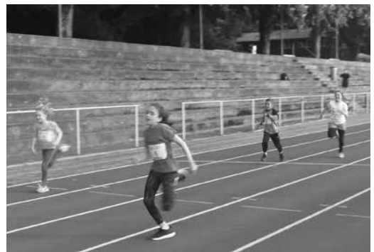
Durchziehen und dran bleiben...