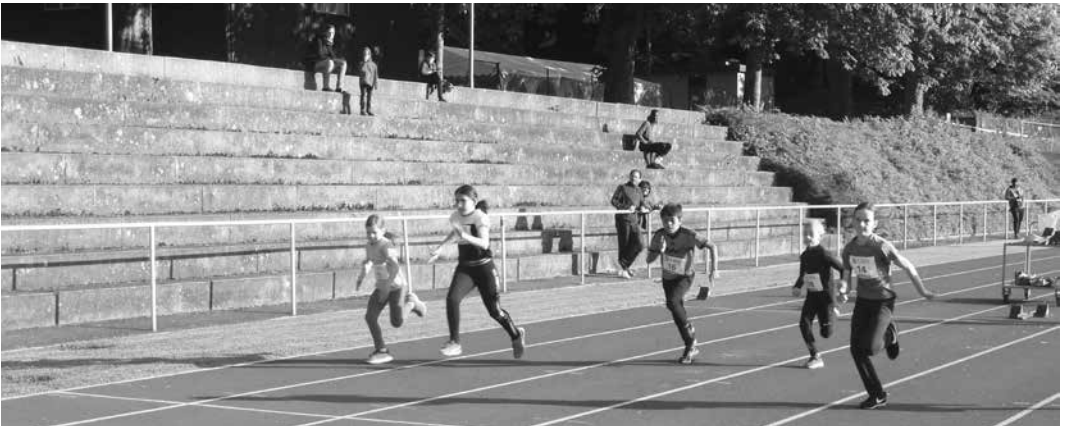
60 m Sprint