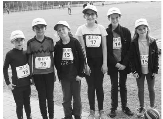
Diese Mädchen haben es in sich!