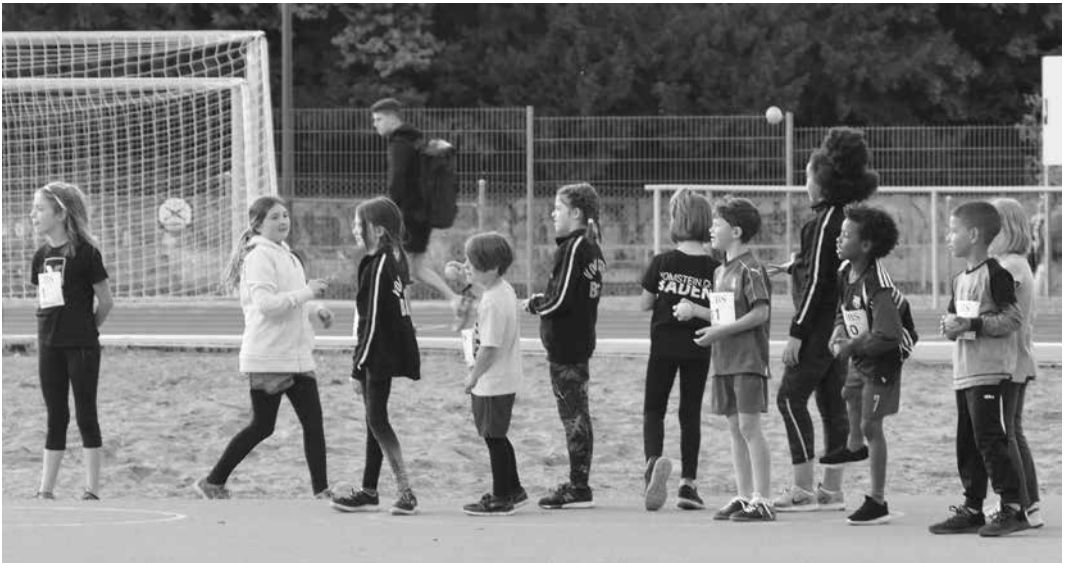
Anstehen für den Ballwurf

Auch dieses Jahr versammelten sich die in der Aue die Leichtathleten und eine Volleyballerin für den alljährlichen UBS-Kids Cup. Während sich die Kinder und Jugendlichen bis Jahrgang 2004 im Dreikampf (60m / Ballwurf / Weitsprung) sorgten die älteren Leichtathleten, nach all den Jahren bereits ein gut eingespieltes Team, als Coaches oder Kampfrichter für einen reibungslosen Ablauf. Wie jedes Jahr bekamen alle am Schluss einen Mohrenkopf mit auf den Weg.